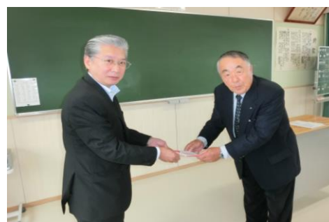
平成27年9月25日（金） 場所 石巻市特別支援教育共同実習所(住吉中学校内) 石巻管内特別支援学級後援団体連絡協議会