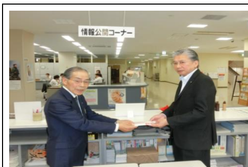
平成27年9月25日（金） 場所 石巻市役所4階生涯学習課 石巻市子ども会育成会